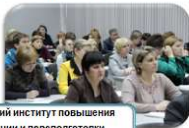
Новосибирский институт повышения квалификации и переподготовки работников образования