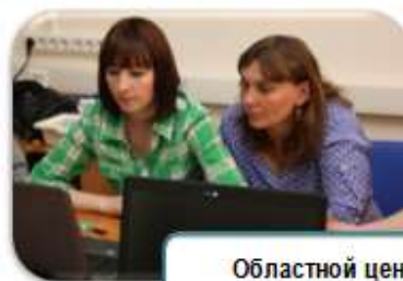
Областной центр диагностики и консультирования