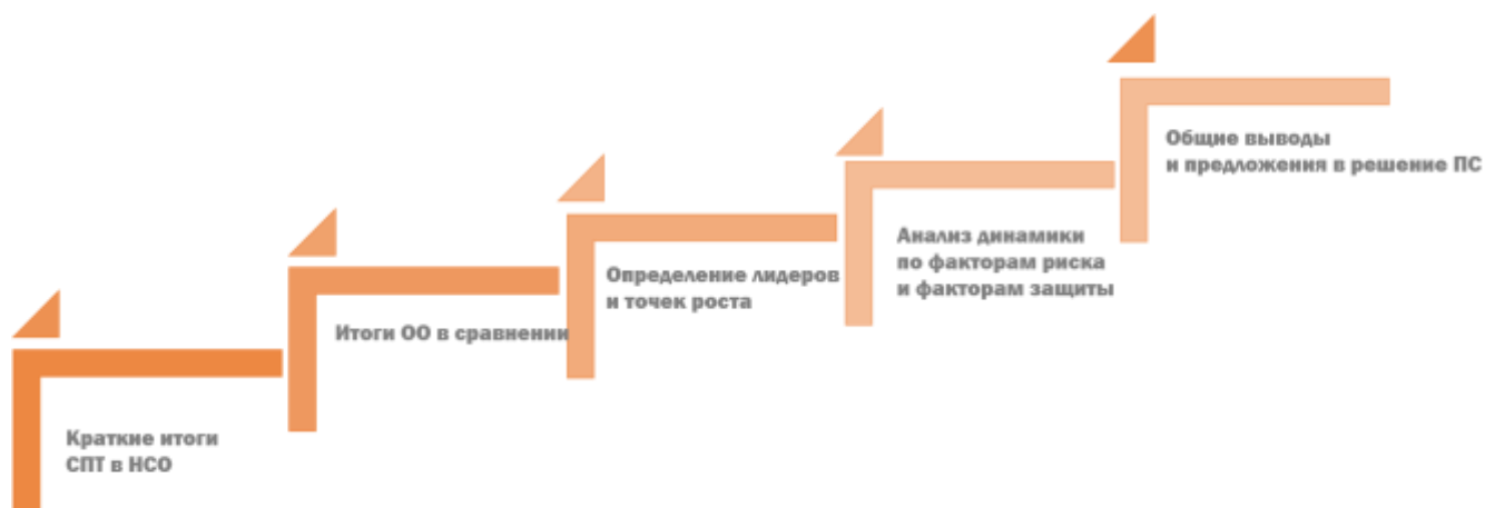
Рис. 2. Схема представления результатов СПТ на педагогическом совете