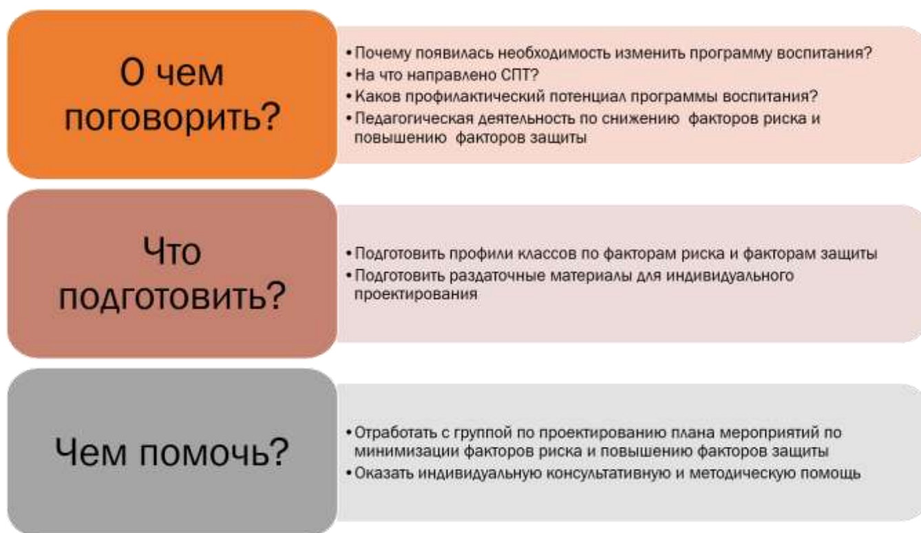
Рис. 4. Схема работы по результатам СПТ с классными руководителями/кураторами групп